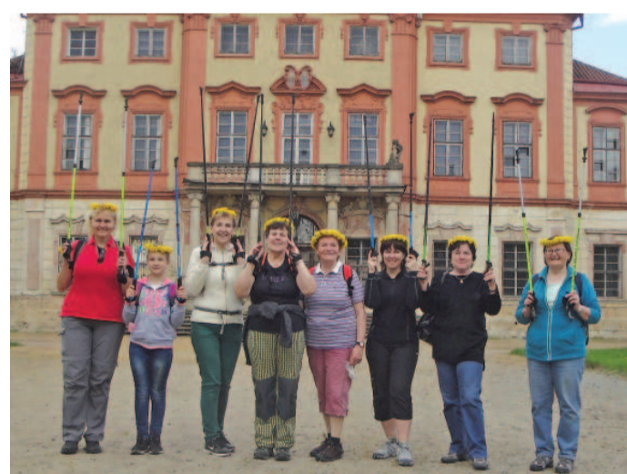
NORDIC walking výletu se tentokrát účastnilo také několik zástupců mužského pohlaví, a dokonce i psí mazlíček.

Mělnický deník, Kapitána Jaroše 295, 276 01 Mělník