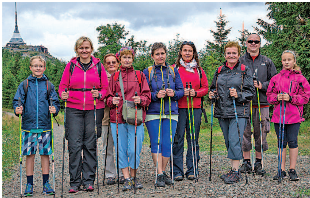
PO JEŠTĚDU bude cílem fanoušků nordic walkingu poslední srpnovou neděli hora Říp.

Pod kamenem je na vyhlídce stůl a lavička, kde jsme se rozhodli poobědvat. Je neuvěřitelné, kolik laskomin naše bařůžky skrývaly tentokrát. Dvě naše dámy nás pohostily výbornými koláči, bo-