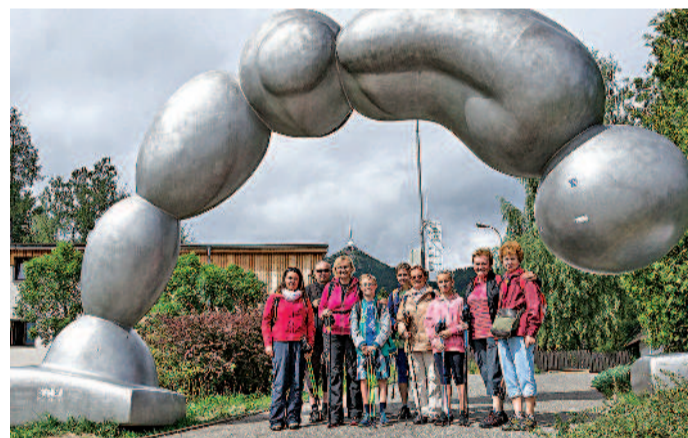
ÚČASTNÍCI výletu si užili krás přírody a sdíleli společně při povídání a smíchu nádherný letní den. Foto 3x: Nordic walking pro radost